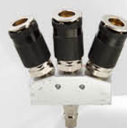
29822 日式快插式快速接头 - 带进气插头三通